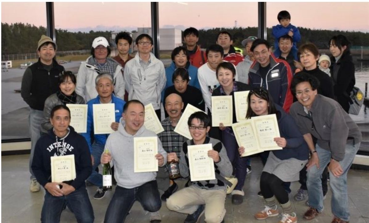
笑顔いっぱいの幸せな時間。上：第34回全日本選手権@蒲郡、下：ウィンターレガッタ@稲毛