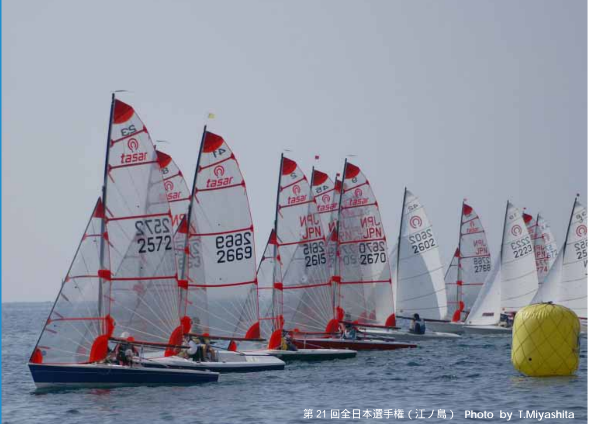
第21回全日本選手権（江ノ島）