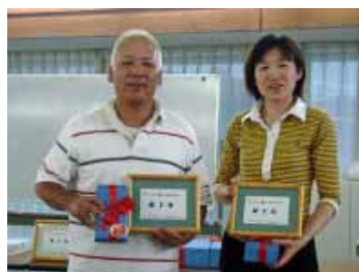
第2位・マスタークラス優勝